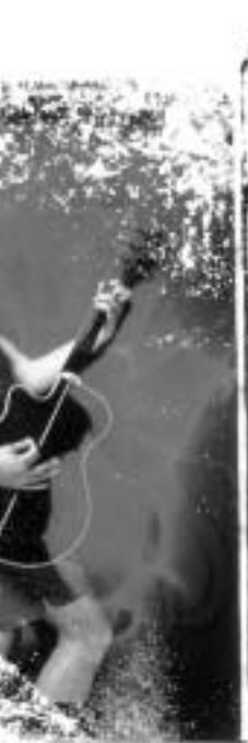
Guitare Emir Kusturica