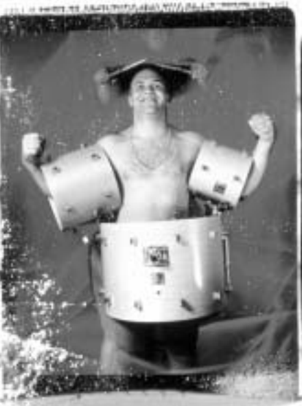
Batterie Stribor Kusturica