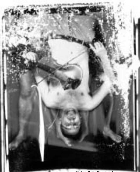
Violon Deja Sparavalo